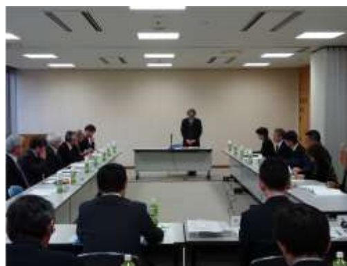
大館市都市計画審議会