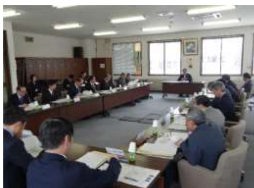
大館市歴史的風致維持向上協議会

作成された計画案は、関係者協議や地区座談会による意見交換を重ね、また市民へのパブリックコメントを実施し、大館市文化財保護審議会や大館市都市計画審議会への報告、大館市歴史的風致維持向上協議会(歴史まちづくり法第 11 条の法定協議会)における検討を踏まえ、「大館市歴史的風致維持向上計画」として決定した。